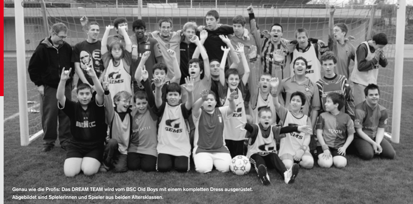
Genau wie die Profis: Das DREAM TEAM wird vom BSC Old Boys mit einem kompletten Dress ausgerüstet. Abgebildet sind Spielerinnen und Spieler aus beiden Altersklassen.